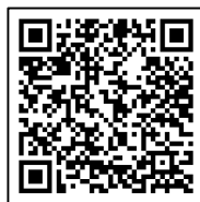
Figura 2. Código QR para acceder al Programa del Segundo Foro de Competencia Lingüística.

Los ponentes provinieron de nuevos espacios académicos, ocho de la UAEMex (siete Facultades y el Centro Universitario Zumpango - CUZ), así como de la Centenaria y Benemérita Escuela Normal para Profesores (CBENP). Las facultades participantes fueron: Lenguas, Geografía, Odontología, Humanidades, Turismo y Gastronomía, Medicina y Ciencias de la Conducta (Figura 3).