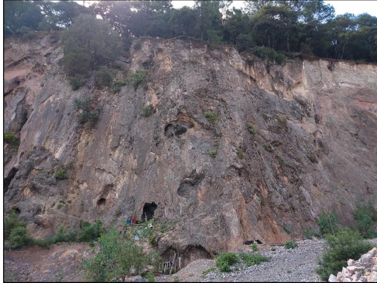
Figura 9. Afloramiento de mármol al interior del Parque Nacional de los Mármol. Estado de Hidalgo.

Actividades realizadas y sugeridas: Se realiza la caracterización del perfil estratigráfico y correlación geológica, geomorfológica y paisajística en el contexto regional. Se incluye el análisis histórico regional contrastado con la legislación mexicana vigente.