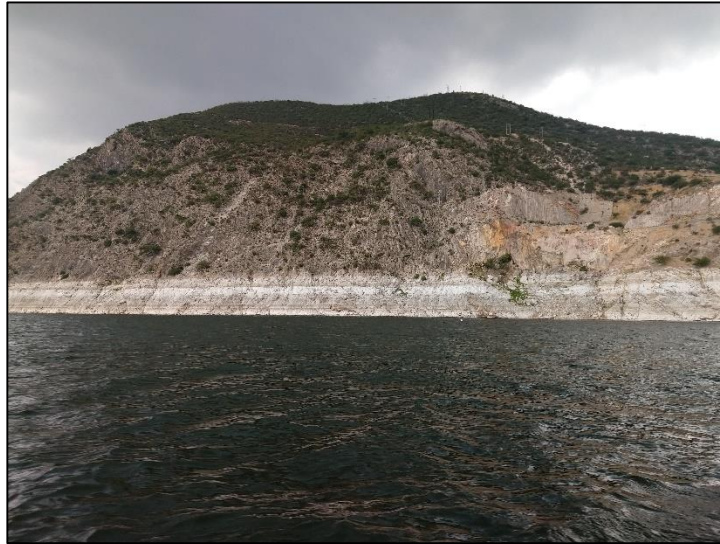
Figura 7. Afloramientos de calizas en la presa de Zimapán; límite estatal entre Hidalgo y Querétaro.

regionalmente con los yacimientos de placer productores de oro y zinc, los cuales se extienden a Querétaro.