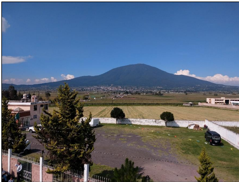
Figura 4. Vista del volcán Jocotitlán, Estado de México.

Se realizan observaciones referentes a la densidad de vegetación y estado que guarda en el contexto general de las geoformas y el uso de suelo. Se destaca la correlación productividad agropastoril, calidad y temperatura del agua.