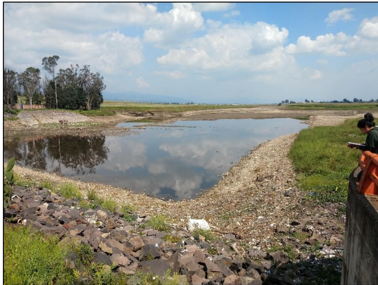
Figura 3. Cortina de la presa Juan Antonio Alzate, Estado de México.

Se observa que el filtro y los productos químicos empleados para purificar el agua resultan insuficientes y que el entorno en general es tóxico; así que el impacto en general es alto.