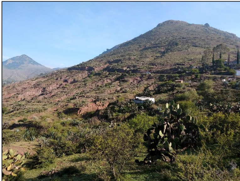
Figura 8. Sistema erosivo de cárcavas en Pacula, Estado de Hidalgo.

Se observan formaciones de cárcavas por escurrimientos y erosión fluvial, algunas de ellas son de forma rectangular alargada y otras son de escalonamiento, la primera se forma porque el tipo de material es deleznable, y la segunda porque la biota interviene en su formación, se presentan deformaciones en el terreno conocidas como “pie de vaca”, provocadas por el tránsito continuo de ganado en las laderas. El material poco consolidado, las condiciones climáticas, meteorológicas y las actividades agropastoriles los animales se conjugan para la formación cárcavas.