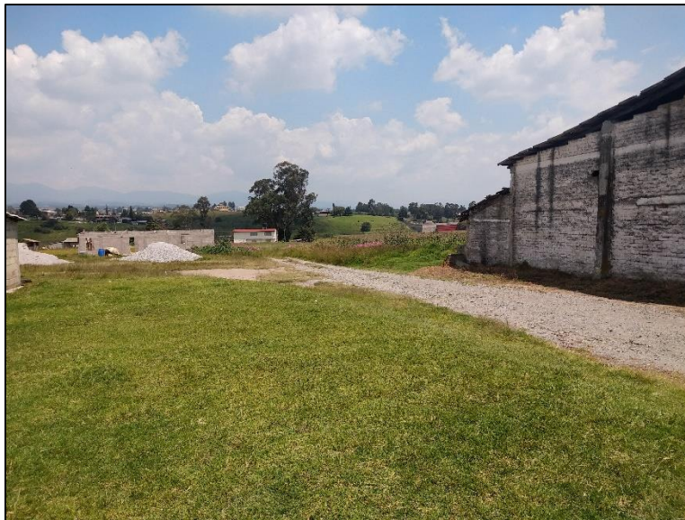
Figura 2. Panorámica del rancho San José en las proximidades de Taborda, Estado de México.

Los procesos exógenos que conforman el lugar es la existencia de cárcavas escalonadas características por el cambio de material de los estratos ya que cada uno contiene diferentes tipos de roca y materiales más deleznable que de otros estratos haciendo que la ley geomorfológica de “ mayor pendiente mayor- erosión no se cumpla ”, creando así el tipo de erosión aereolar, la cual es característica porque en la zona existe arena, limo y arcilla sumando la agricultura del lugar y la existencia de ganado que deterioran con el tiempo el suelo.