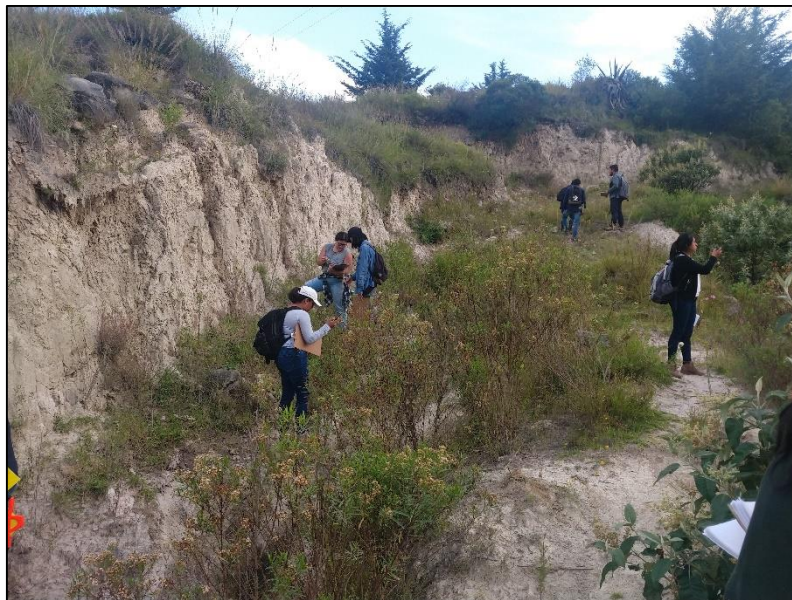
Figura 5. Depósitos de diatomitas en Toxi, Estado de México.

Este lugar tiene una importancia geológica y geomorfológica muy particular ya que aquí se encuentran diatomeas aflorando a más de 40 metros sobre el nivel de base, se encuentran diaclasas y fallas con movimientos verticales y horizontales; así como micropliegues en estratos paralelos de sedimentos que presentan disyunciones.