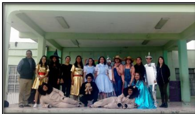
Figura 2. Presentación de estudiantes de sexto semestre de la Licenciatura en Educación Primaria de la obra de teatro “El mago de Oz”

Tercera) se desarrolló la obra de teatro el mago de Oz (Figura 2), la cual tiene el propósito de favorecer los valores; la primera función dio inicio a las 8:10 de la mañana el día 14 de junio de 2019, el público presente fueron alumnos de los grados de segundo, cuarto y sexto. La segunda función comenzó a las 09:30 y el público asistente fueron los grados de primero, tercero y quinto.