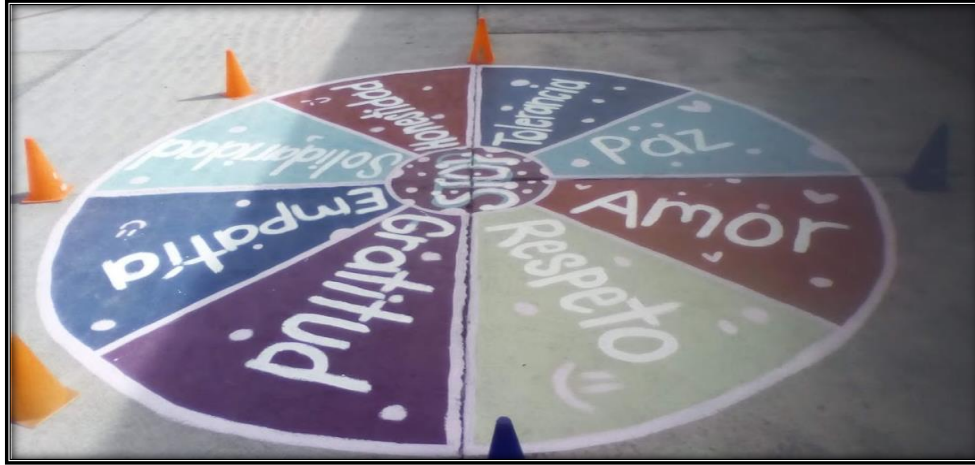
Figura 1. Pintar juegos de patio, actividad lúdica denominada Stop pintado en el patio central de ceremonias de la Escuela Primaria “Hermenegildo Galeana”

En cuanto a la convivencia escolar, desde una mirada de transformación es vista como la formación en valores sociales y humanos, así como la generación de acciones que vinculan la convivencia escolar con el ethos (costumbre y conducta) escolar, generando identidad de estudiantes, promoviendo acciones que trasciendan en el aula y previniendo fenómenos como la violencia (López, 2014). De aquí, la decisión teórica de implementar juegos como actividad fuera del aula y con un enfoque lúdico y recreativo.