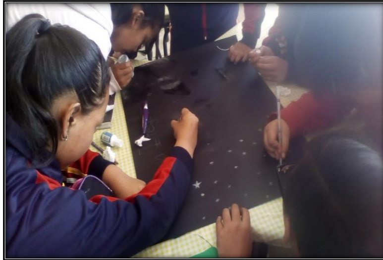
Figura 3. Actividades grupales, alumnos de 6º “B” trabajando en equipo

Las actividades realizadas tienen como propósito generar ambientes de aprendizajes favorables en cada sesión ya que la sana convivencia favorece la creación de este tipo de ambientes, “Se denomina ambientes de aprendizaje al espacio donde se desarrolla la comunicación y las interacciones que posibilitan el aprendizaje” (SEP, 2011, p. 28)