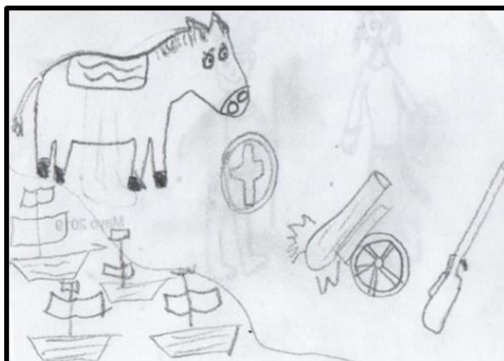
Figura 1. Objetos de guerra Mesoamericanos

dibujos (Figura 1), que por parte de las civilizaciones mesoamericanas los objetos de guerra eran flechas, hondas o rocas, así como una de las herramientas más importante por nuestras civilizaciones en los combates de hombre a hombre que era el Macuahuitl.