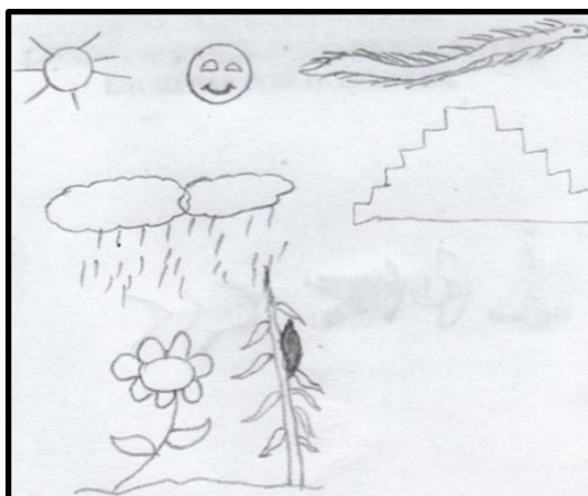
Figura 3. Dioses del México Antiguo

Refiriéndonos a la religiosidad que se tenía por las civilizaciones nativas, los docentes (Figura 3), plasman los dioses que se les daba tributo como lo son: el sol, la luna, la lluvia, el viento, así como Quetzalcóatl o la serpiente emplumada. También expresan la adoración que se le tenía a la naturaleza y a sus cosechas como es el maíz.