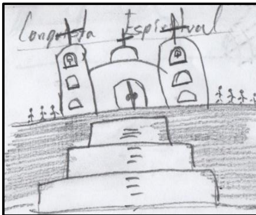
Figura 4. Construcción de Iglesias

Haciendo alusión al simbolismo religioso de los españoles, los docentes muestran elementos relevantes, y los de mayor coincidencia son: la cruz, la biblia, la virgen, la iglesia y los conventos, así como frailes o personas dedicadas a la propagación de su religión. Observamos (Figura 4), la estrategia de destrucción o sepultura de pirámides y ahí mismo realizar la construcción de iglesias.