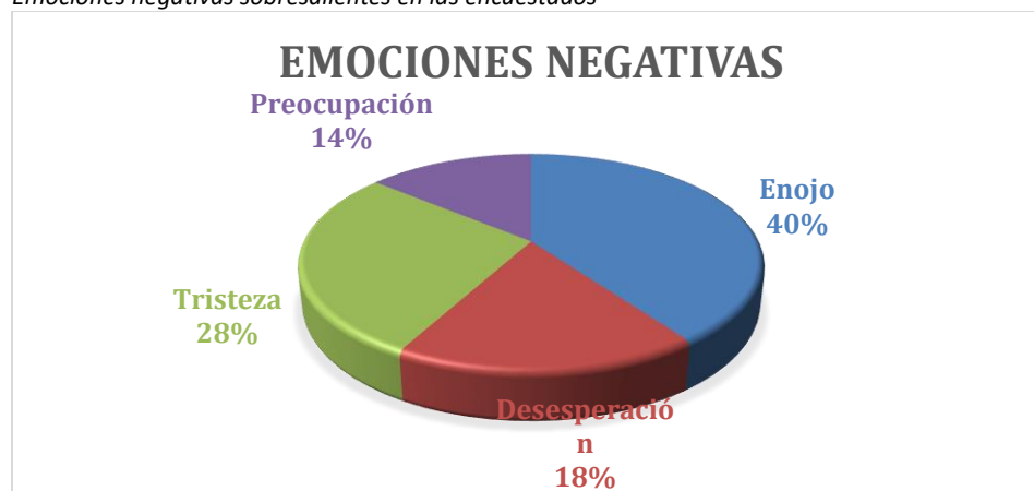
Figura 2 Emociones negativas sobresalientes en las encuestados

A medida que el docente, organiza su ambiente virtual de aprendizaje, valiéndose de cada una de esas herramientas digitales a su alcance, las actividades se vuelven llamativas, interesantes y entendibles por el alumno, las emociones que sobresalen en cada alumno, con un 36% alegría,