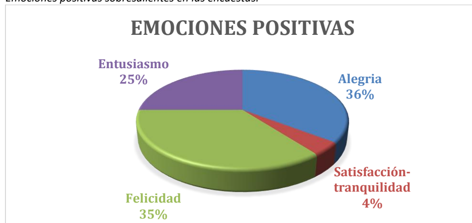
Figura 3 Emociones positivas sobresalientes en las encuestas.

35% felicidad, 25% entusiasmo y 4% satisfacción y tranquilidad; favoreciendo su autonomía por el aprendizaje e involucrándose en los medios a su alcance para fortalecer sus conocimientos, y así favorece al logro del perfil de egreso en educación básica.