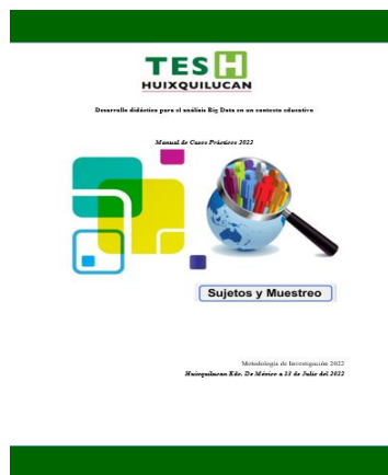
Ilustración 4 Portada

En la ilustración 4. Se muestra la portada del instrumentó de enseñanza-aprendizaje para Big Data.