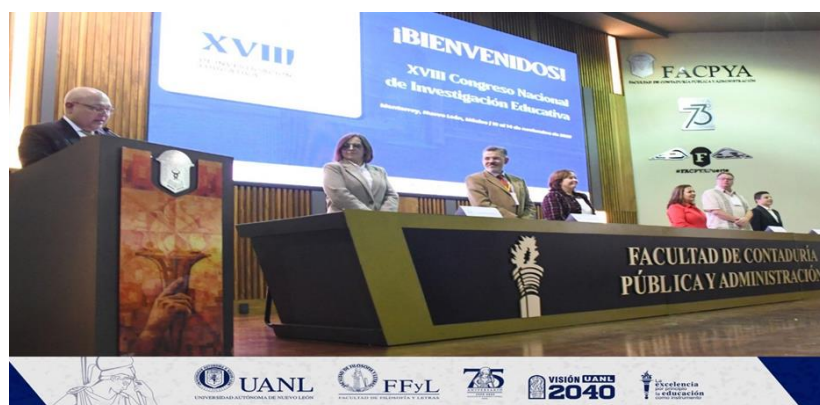
Inauguración del XVIII Congreso Nacional de Investigación Educativa (CONIE 2025) Monterrey, Nuevo León

ORCID https://orcid.org/0000-0003-3423-668X